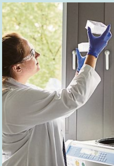
Die Diabetesforschung macht Fortschritte

Münchner Forscher: Bluttest und neues Medikament verbessern Behandlungsmöglichkeiten